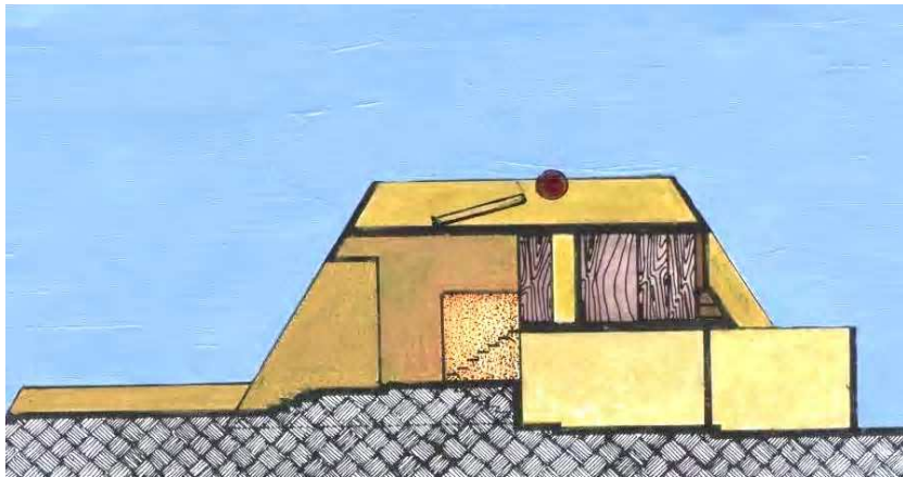
CORTE POR ESCALERA

TERRENO DE 8.00 MT X 20.00 MT AREA CONSTRUIDA 130.00 M 2 . LA CASA SE SOPORTA SOLA CON LOS MUROS COLINDANTES Y EL NUCLEO CENTRAL DE BAÑOS LAS SUBDIVISIONES EN P.A. LA SON TODAS DE MADERA O TABLA ROCA CON LOS QUE SE SATISFACIAN LAS DIFERENTES EXIGENCIAS DE LOS COMPRADORES.